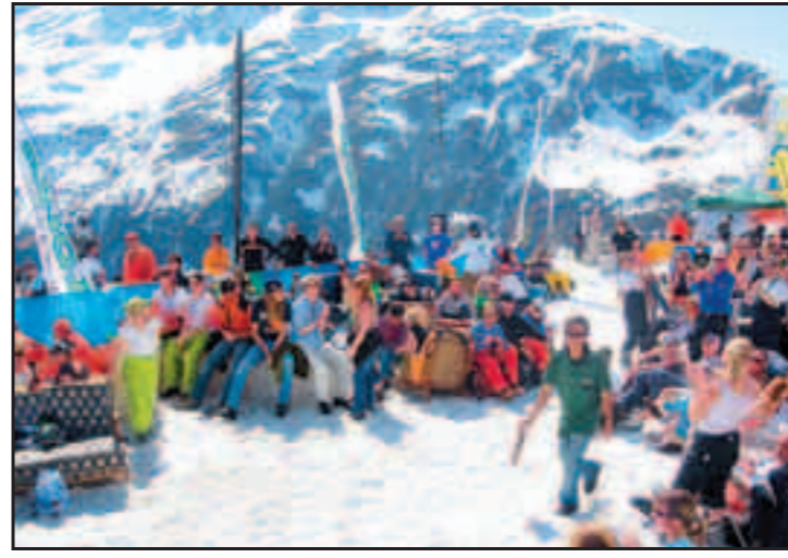
Das Frühjahr steht in St. Anton im Zeichen des Skisports. Viel Schnee und Sonne sorgen für höchsten Genuss.